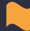
PHOTO VIVEZ UNE SEMAINE SAINTE MISSIONNAIRE ! DÉCOUVREZ LE CALENDRIER

Pour l'impression du calendrier à offrir en paroisse.